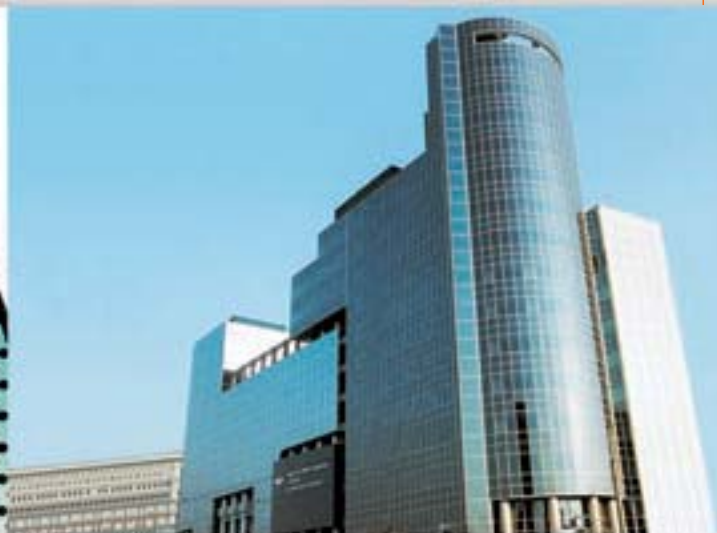
Projeto AMF Câmara de Comércio e Indústria, Romênia