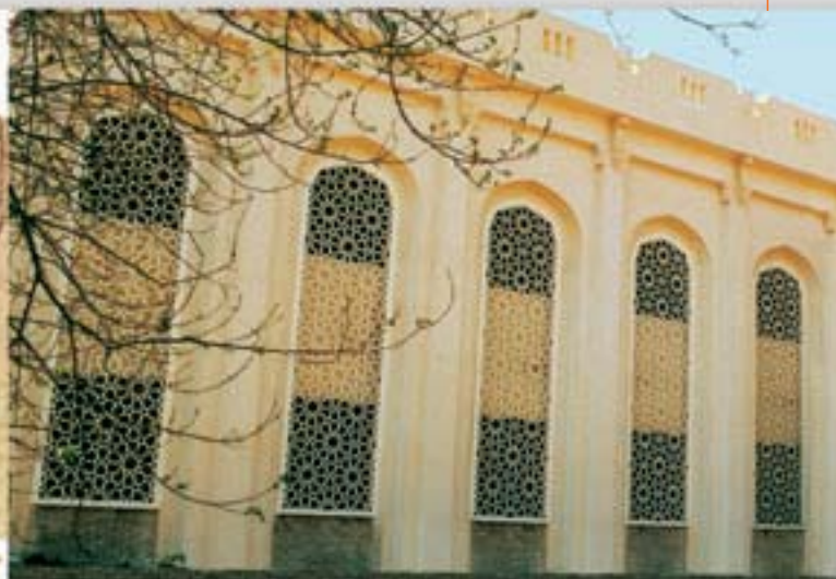
Projeto AMF Universidade do Cairo, Egito