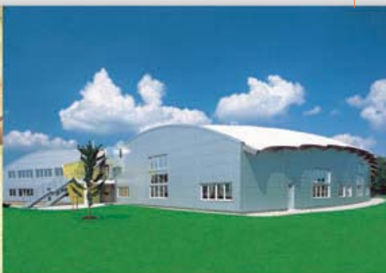
Projeto AMF Skyspan Rimsting, Alemanha