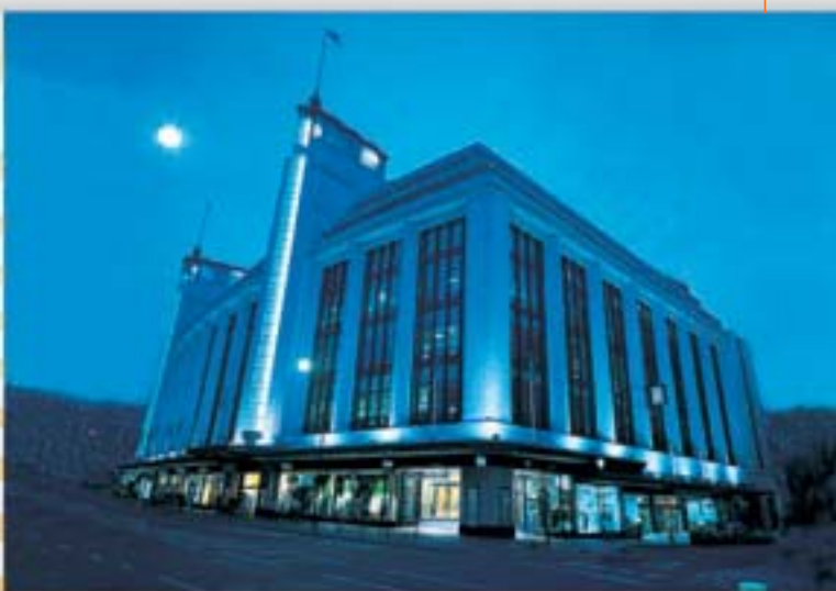
Projeto AMF Barkers Department Store, Grã Bretanha