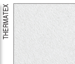
Thermaclean S -branco