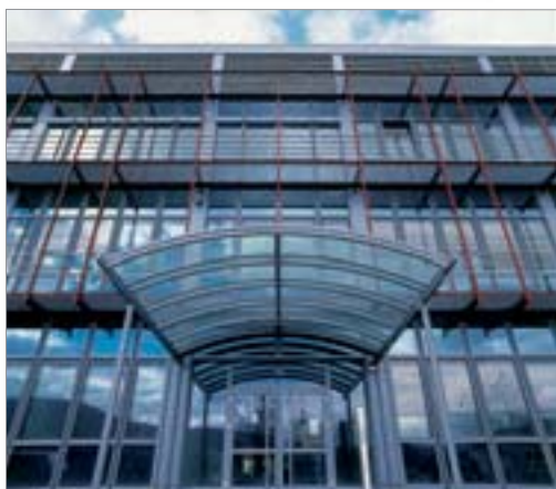
Projeto AMF: Laboratório Médico Jena, Alemanha