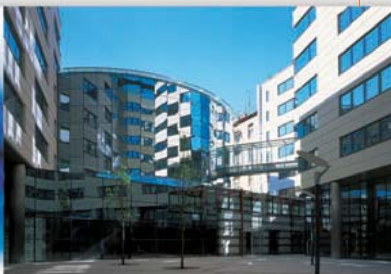
Projeto AMF Banco Central, Hungria